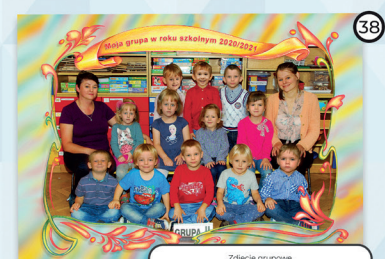
38 Zdjęcie grupowe z nakładką cyfrowo ramką 15x21 cm cena 14 zł