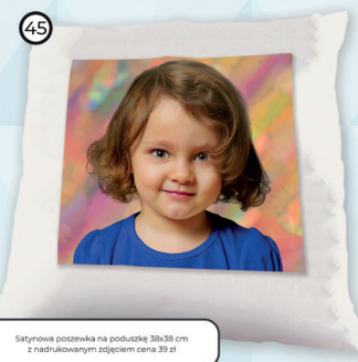
45 Satynowa poszewka na poduszkę 38x38 cm z nadrukowanym zdjęciem cena 39 zł