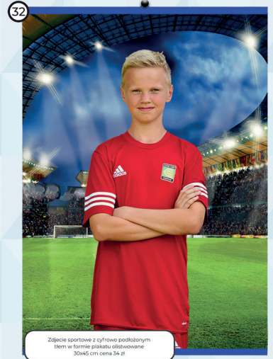
32 Zdjęcie sportowe z cyfrowo podłożonym tłem w formie plakatu olistowane 30x45 cm cena 34 zł