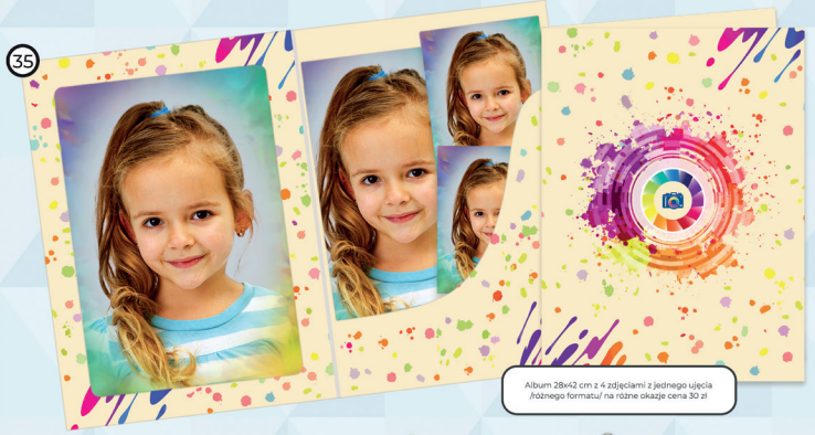
35 Album 28x42 cm z 4 zdjęciami z jednego ujęcia (różnego formatu) na różne okazje cena 30 zł