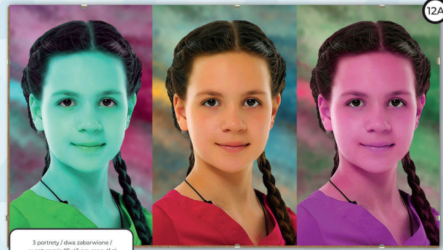
12A 3 portrety / dwa zabarwione / w antyramie 25x45 cm cena 41 zł