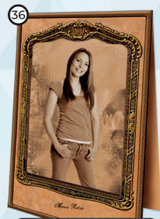
36 Zdjęcie w sepi w ramce teksturowej 17x24 cm cena 28 zł