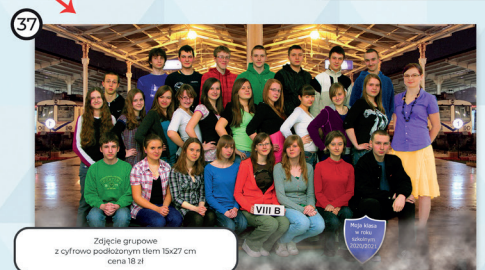
37 Zdjęcie grupowe z cyfrowo podłożonym tłem 19x27 cm cena 18 zł

REALIZACJA PRZY ZAMÓWIENIU TYLKO JEDNEGO WZORU DLA KLASY