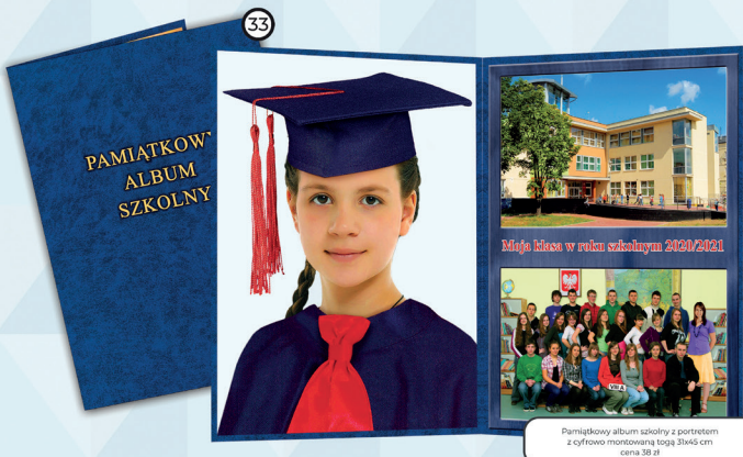
33 Pamiątkowy album szkolny z portretem z cyfrowo montowaną tęgą 31x45 cm cena 39 zł