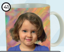
41 Kubek ceramiczny z wysalonym po dwóch stronach zdjęciem cena 36 zł