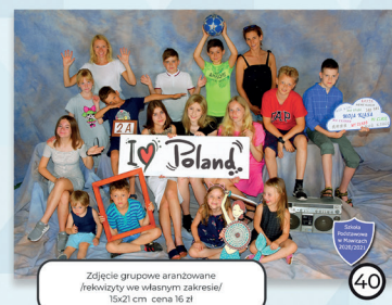
40 Zdjęcie grupowe aranżowane /rekwizyty w wybranym zakresie/ 15x21 cm cena 16 zł