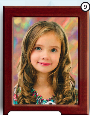
9 Portret na płótnie w brązowej plastikowej ramce 24x31 cm cena 39 zł