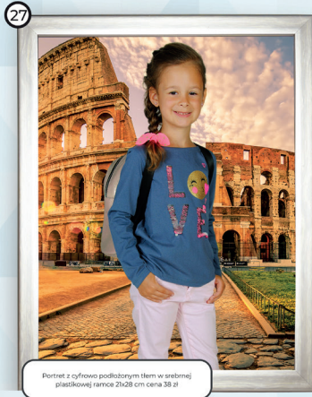
27 Portret z cyfrowo podłożonym tłem w srebrnej plastikowej ramce 21x28 cm cena 38 zł