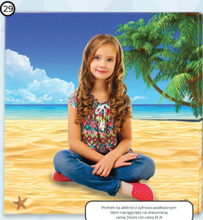
29 Portret na płótnie z cyfrowo podłożonym tłem naciągany na drewnianą ramę 26x24 cm cena 51 zł