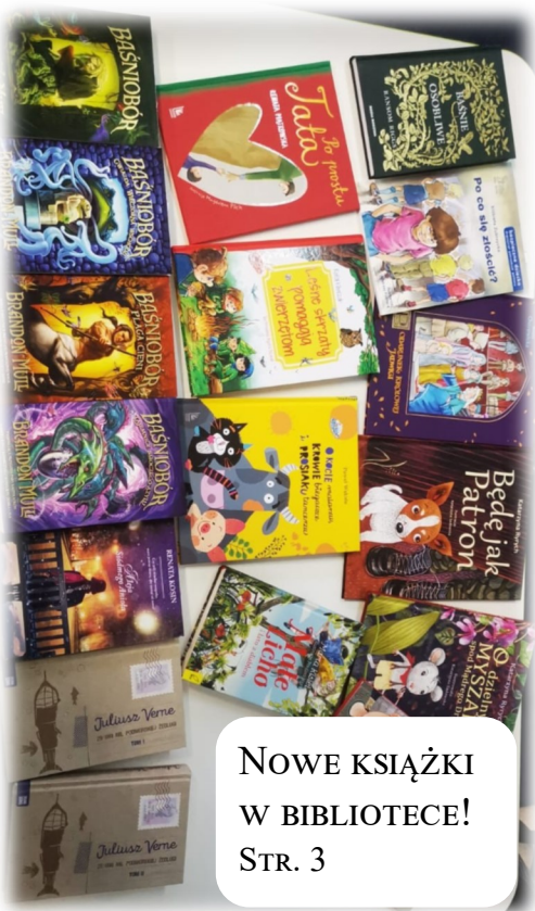
NOWE KSIĄŻKI W BIBLIOTECE! STR. 3