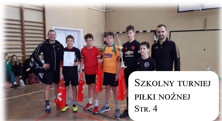
SZKOLNY TURNIEJ PIŁKI NOŻNEJ STR. 4