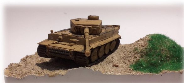
Niemiecki czołg ciężki - "Tiger"