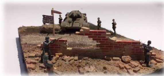
Armia czerwona wraz z czołgiem t-34/76 wspierając atak sami niemieckiej